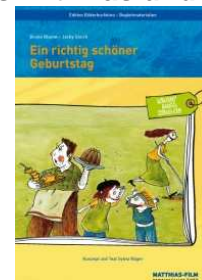
Ein richtig schöner Geburtstag von Bruno Blume u. Jacky Gleich

Bitte beachten Sie, dass sich durch die Neuerscheinungen auch die Gesamtliste der Bilderbuchkinos aktualisiert hat: http://www.hlb-wiesbaden.de/index.php?p=168