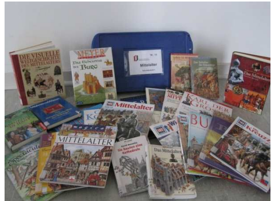
Einer der diesjährigen Ausleihrenner die Themenkiste „Mittelalter“