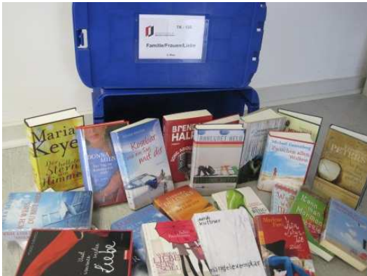
Eine der neuen Themenkisten 2012 „Familie/Frauen/Liebe“

Ausleihrenner: Platz 1: TK 127 Sachbücher Kochen/Basteln/Nähen Platz 2: Teilten sich gleich mehrere Kisten u.a. TK 13 Mittelalter, TK 128 Sachbücher Sport/Fitness und alle Kisten zum Thema Nationalsozialismus