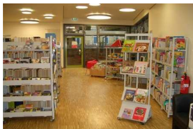
Schul- und Stadtteilbücherei Dreieich-Götzenhain