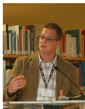
Fotos: Fortbildung 80 Jahre Hessische Fachstelle – Qualität für Bibliotheken am 2.11. in der Stadtbibliothek Gießen