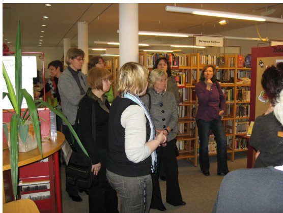
Foto: Kreistreffen in Reinheim 2009