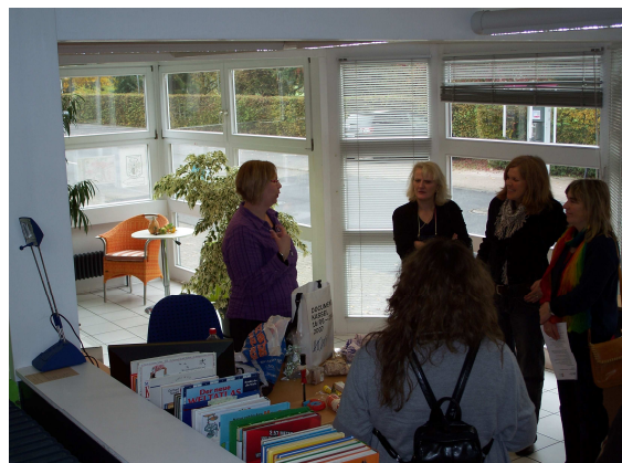
Kreistreffen mit Wochenendseminar in Bad Salzschlirf 2009